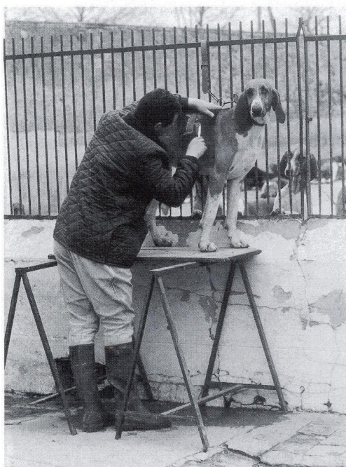
La marque aux ciseaux...