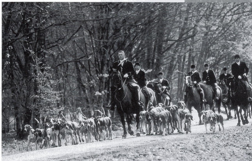
L'arrivée au rendez-vous : les chiens sont emmenés couplés derrière le cheval du piqueux.