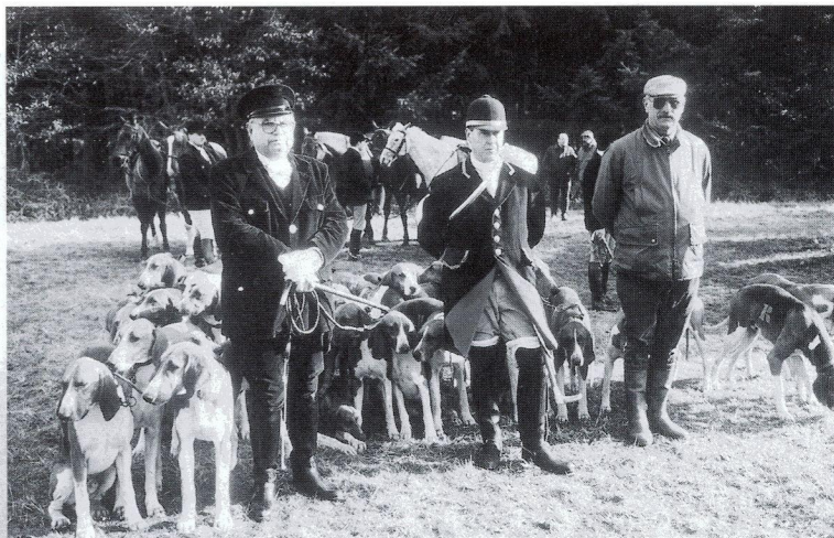
Au rendez-vous, à 10 h 30 au Carrefour des Huit Routes, avant le rapport.