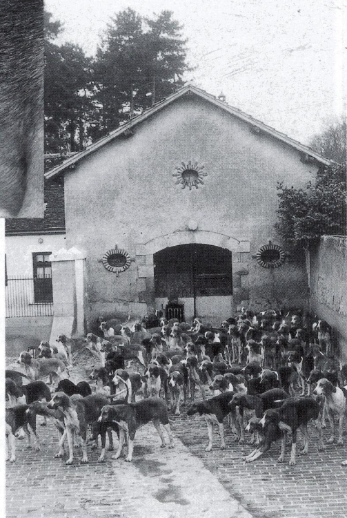
Les 90 poitevins dans la cour de 300 m 2 du grand chenil.