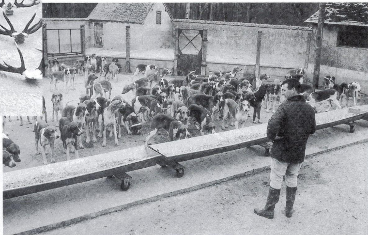
Les chiens sont mis sous le fouet.