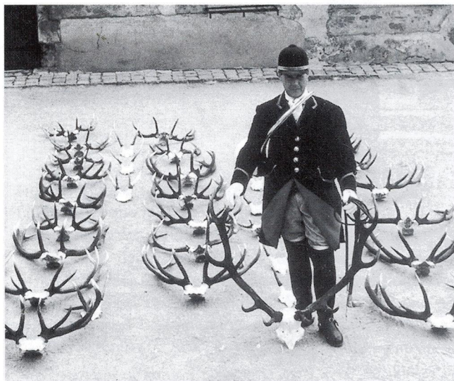
Les trophées de la saison 95-96 présentés par La Brisée, 1 er piqueux.